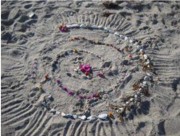
Mandala af strandens blomster, tang og sten.

I kan også lave særlige regler for, hvad der skal være i jeres mandala. Se nedenfor hvordan I kan bruge mandala i skolen.