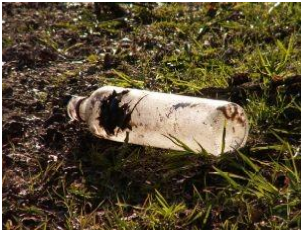
Flasker med madrester er farlige fælder for dyr. Det sorte i flasken er rester af døde mus.

Større dyr kan også komme til skade på glasskår og dåser, som ligger i naturen.