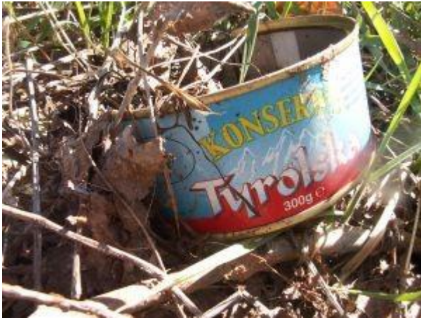
En konserves-dåse er skarp og farlig for dyrene i naturen.