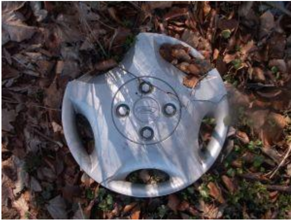
En hjulkapsel - til metal.