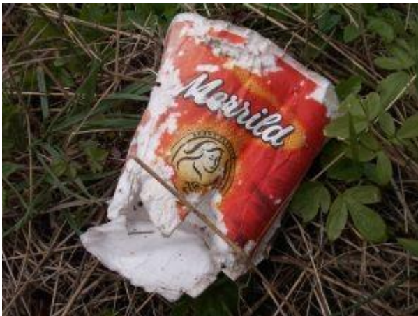
Kaffekrus af pap i grøftekanten.

Det skrald folk smider i nature forsvinder ikke sådan lige af sig selv.