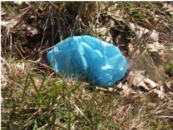
Hvor længe kan denne plastik-overtrækssko ligge her?

I kan gå langs med en vej, langs en strand eller ind gennem et naturområde, hvor I ved der ligger meget affald. Saml alt det gamle slikpapir, alle de grimme dåser, flasker, cigaretskod, plastik, gamle aviser – og alle de andre dimser og ting som folk har smidt i naturen op og put dem i den store sorte sæk. Og se, så er det væk.