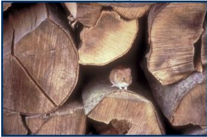
Skovmusen samler nødder og kogler