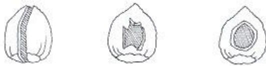
Egernnød, spættennød, musennød Tegning: Eva Wulff

Du kan også se på nødder, om de er blevet spist af egern, mus eller spætte.